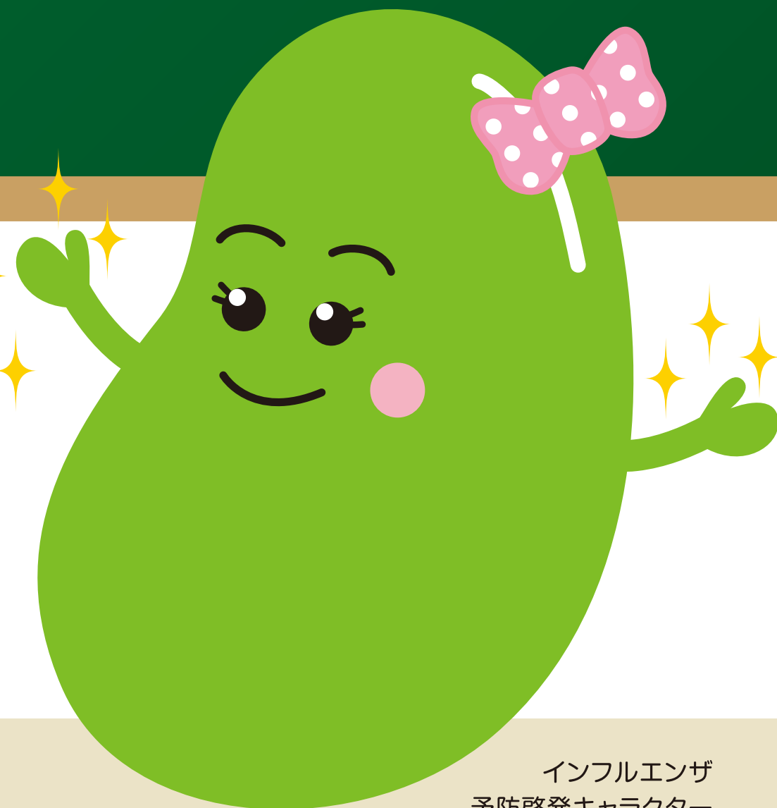
インフルエンザ 予防啓発キャラクター アズキちゃん

みんなの「かからない」、 「うつさない」という気持ちが、 インフルエンザの 予防にはとても大切です。